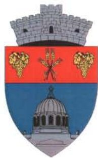
Mircea Vodă Constanța - ROMÂNIA